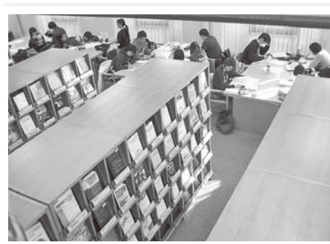
【豊田図書館の近影写真】