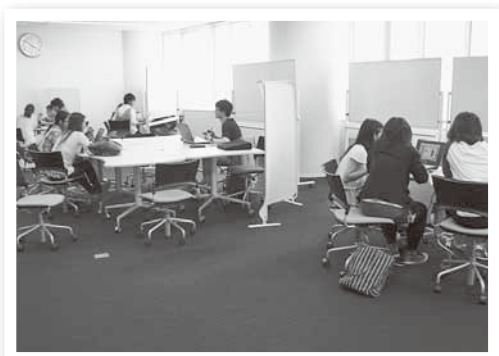
【名古屋図書館の近影写真】

図書館では、昨年全学生対象のアンケート調査をし、1000名近い皆様のご要望を集めました。よりよい利用環境を整え、ひたすら来館を待ち焦がれています。この娘子の片思いの心と同じように……。